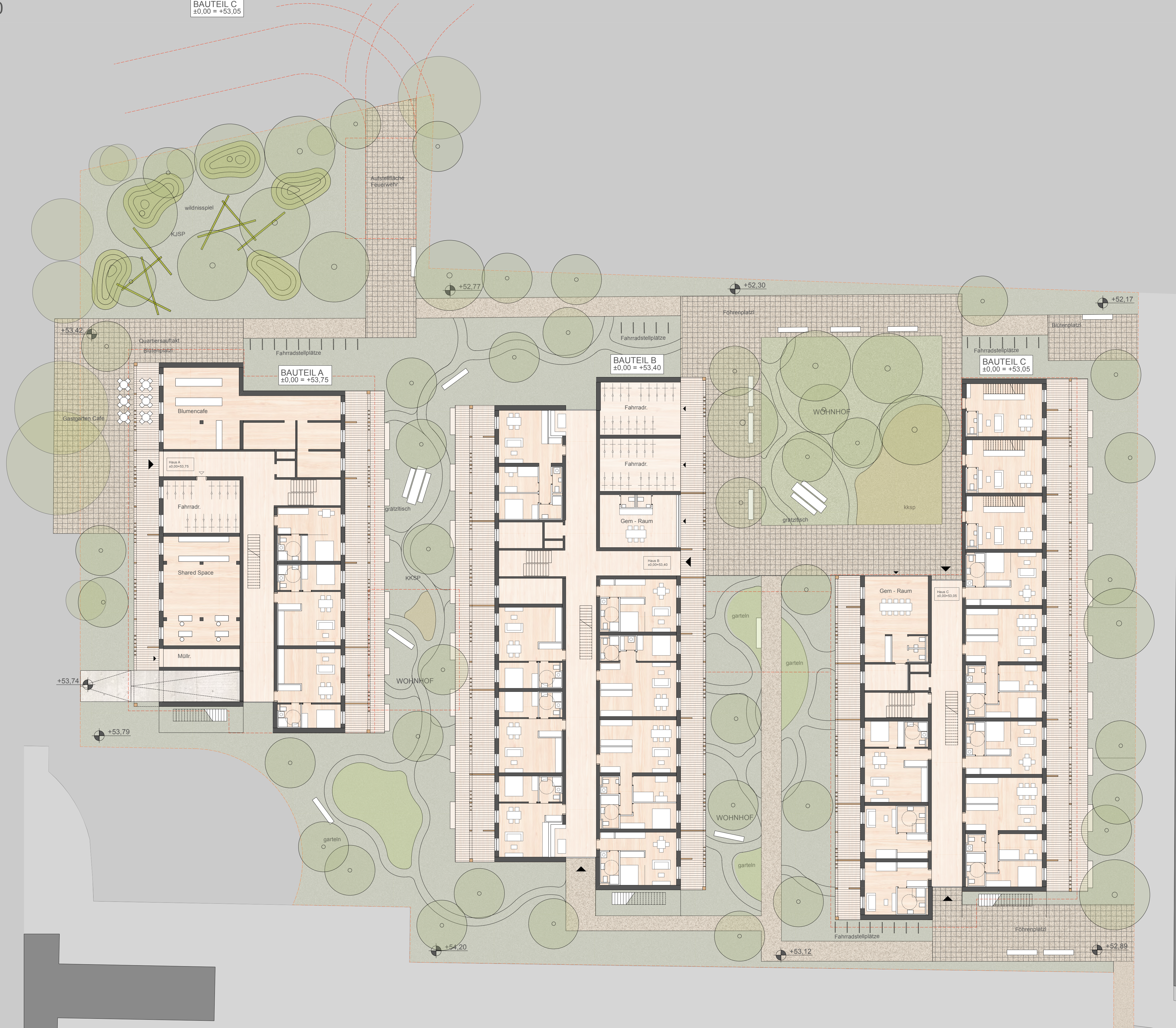
ERDGESCHOSS 1 : 200