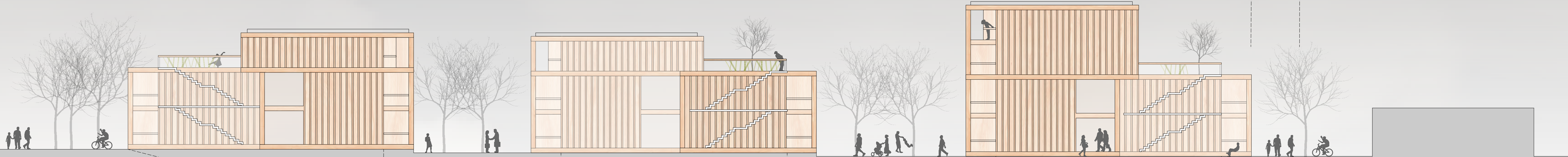
SÜDANSICHT 1 : 200