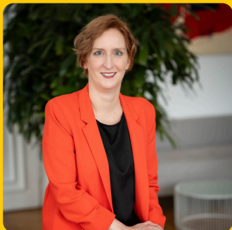
Mag.ª Elke Hanel-Torsch Frauen- und Wohnbaustadträtin, Präsidentin des wohnfonds_wien

Sanierungen und Dekarbonisierungen sind wesentliche Pfeiler der Wiener Wohnbaupolitik und tragen grundlegend zum Erreichen der Klimaziele der Stadt bei.