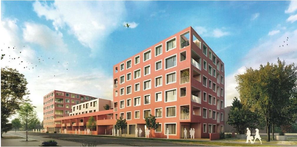
Bildcredits: © AAND3 Architecture & 3D

OASE.inklusiv / Neues Leben Gemn. Bau-, Wohn- und Siedlungsgen.m.b.H. / einzueins Architektur Bayer und Zilker Baukünstler OG / YEWO Landscapes e.U.