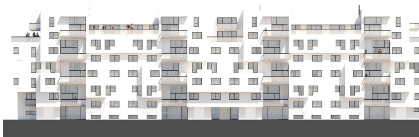
Strassenansicht M 1:200