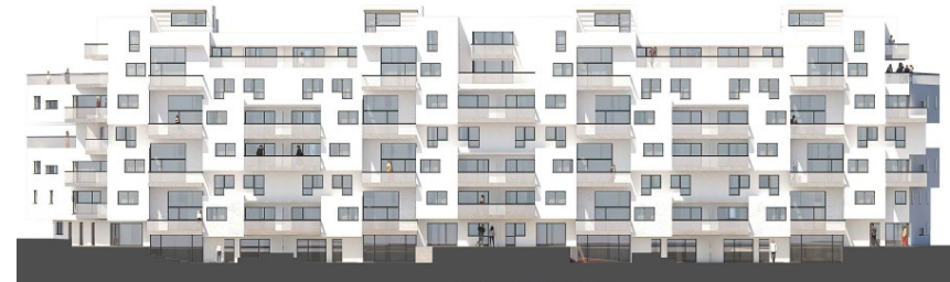
Hofansicht M 1:200